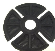
protihluková vložka 1123_S