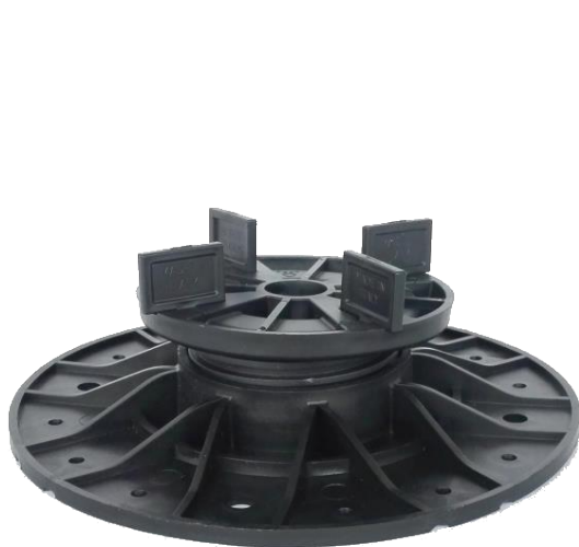
základna A1 (průměr 200 mm) pro výšky do 70 mm