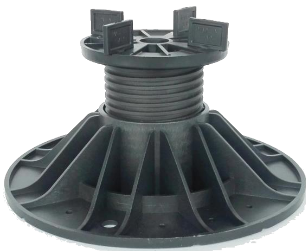
základna A2 (průměr 230 mm) pro výšky nad 70 mm