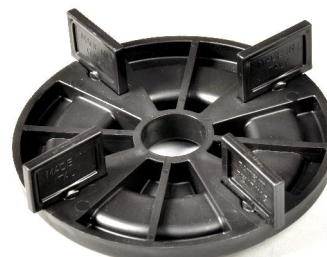
hlava I s nasazenými přepážkami L