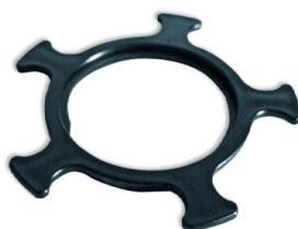
pojistná matice V