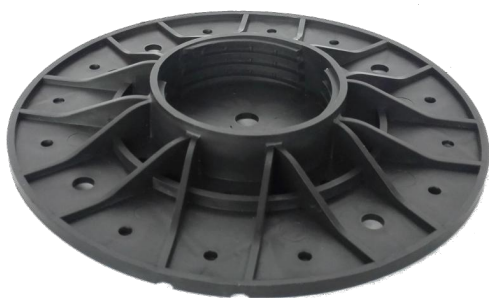
základna A1 – průměr 200 mm plocha základny 314 cm 2