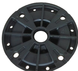
hlava I pohled shora

Při předpokládaném častějším pohybu osob v době užívání prostoru doporučujeme aplikovat pojistnou matici V . Pojistnou matici lze použít pro šneky B , C a D utažením proti základně.