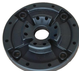
hlava I pohled zespodu