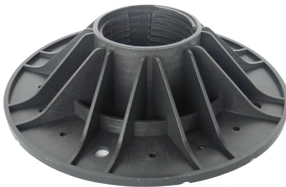
základna A2 – průměr 230 mm plocha základny 415 cm 2