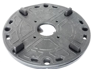
hlava J s nasazenou protihlukovou vložkou 1143-G