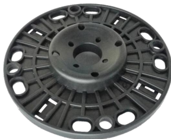
hlava J pohled zespodu