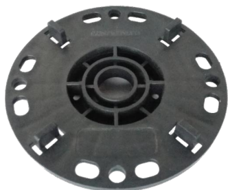
hlava J pohled shora

Při předpokládaném častějším pohybu osob v době užívání prostoru doporučujeme aplikovat pojistnou matici V . Pojistnou matici lze použít pro šneky B , C a D utažením proti základně.