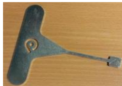
montážní klíč K